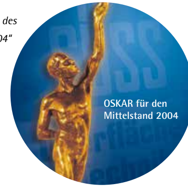
OSKAR für den Mittelstand 2004

Wir sind Preisträger des „Oskar für den Mittelstand 2004“